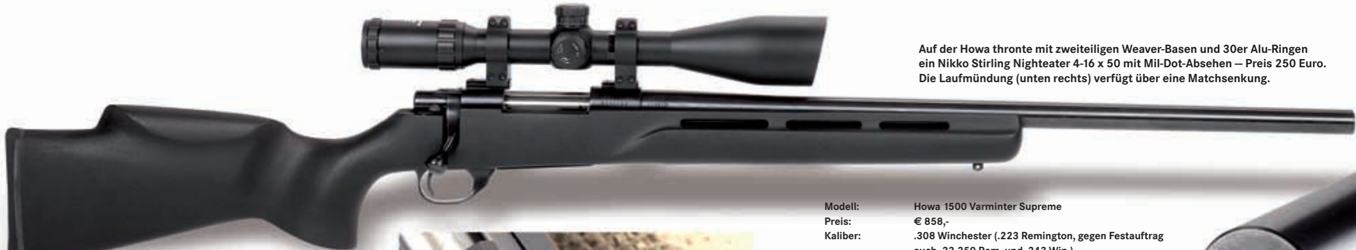
Auf der Howa thronte mit zweiteiligen Weaver-Basen und 30er Alu-Ringen ein Nikko Stirling Nighteater 4-16 x 50 mit Mil-Dot-Absehen – Preis 250 Euro. Die Laufmündung (unten rechts) verfügt über eine Matchsenkung.

Abzugsbügel entriegelt wird. Die Zwei-Stellungs-Sicherung rechts wirkt nur auf den Abzug, die neue, verbesserte Version mit drei Stellungen sperrt darüber hinaus auch die Kammer. Der schwere 610-mm-Matchlauf bringt es auf einen Mündungsdurchmesser von 21 mm und weist ebenfalls eine abgedrehte Matchsenkung auf. Die Dralllänge liegt für .223 Rem. und .308 Win. bei 1:12" mit Rechtsdrall. Andere Dralllängen sind erstmal nicht verfügbar. Dafür gegen Festauftrag (bei gleichem Preis)